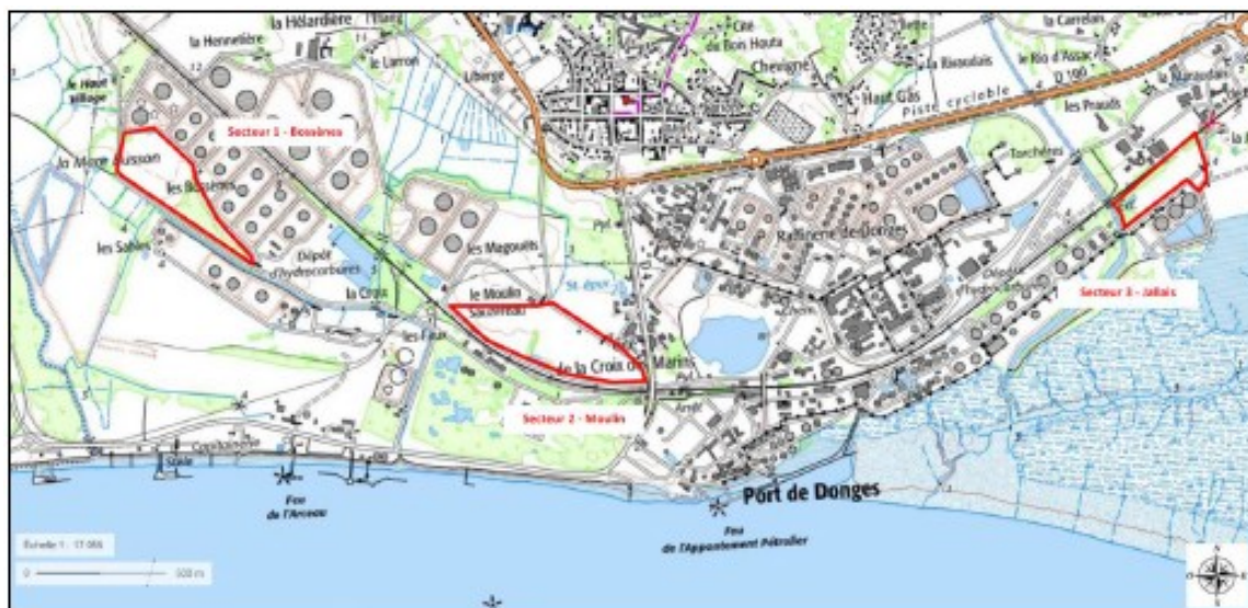
Figure 16 : Localisation des trois zones d'étude sur le site de la raffinerie sur fond IGN

La puissance totale cumulée des deux centrales est de 10 MWc 2 (7,3 + 2,7 MW), pour une production annuelle estimée à 13,5 GWh.